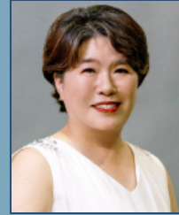
미륵 모 강 행 주