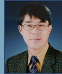
이방 이 의 영