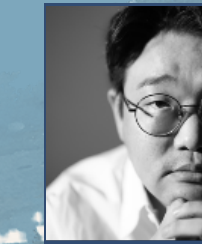
연출 김 민 희