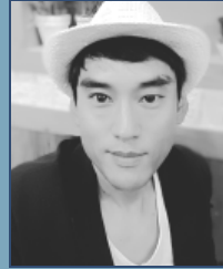
미륵 정 현 진