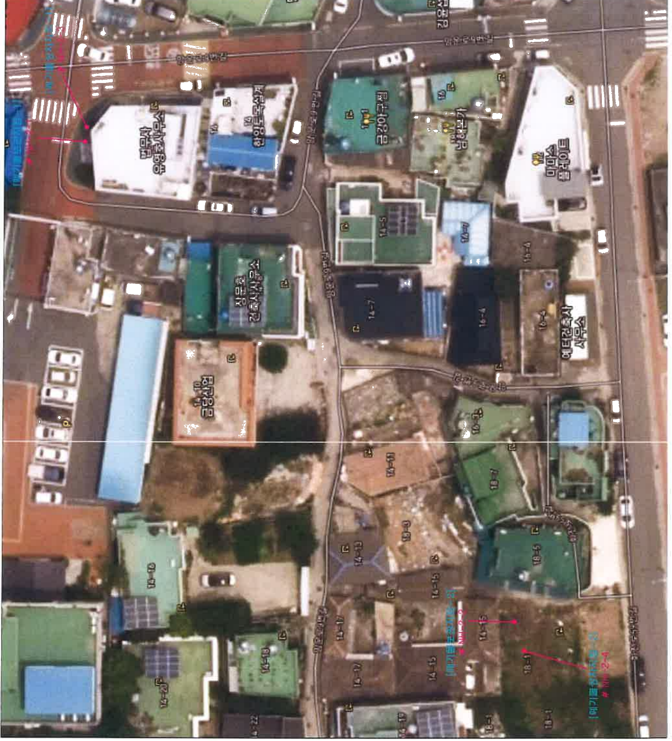
# 별첨 3. 측정장소(측정위치도)