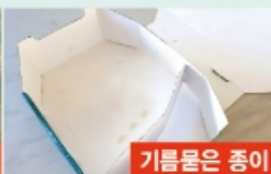
기름 묻은 종이

☑ 스티로폼 : 내용물을 비우고 행군 후 테이프, 택배스티커 등 다른 재질을 제거하고 끈 등으로 묶어서 배출하세요!