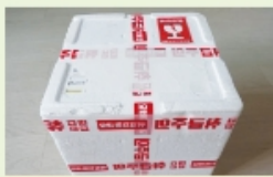
이물질이 묻은 스티로폼